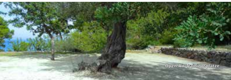
Open Air Trainingsplätze