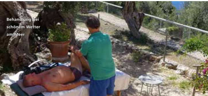
Behandlung bei schönem Wetter am Meer