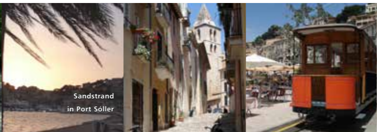
Sandstrand in Port Sóller