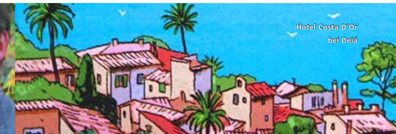
Hotel Costa D'Or bei Deiá