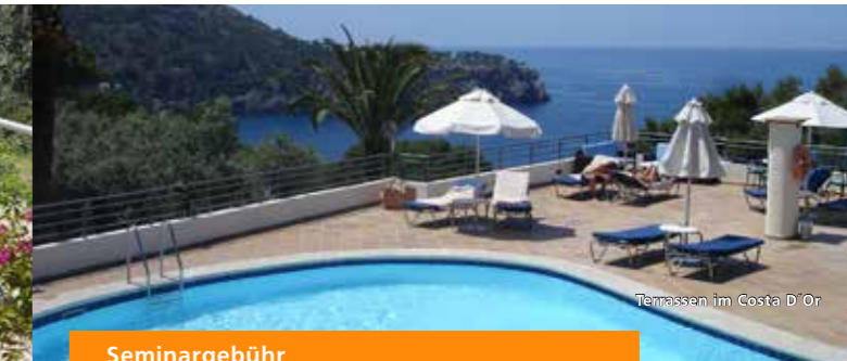
Terrassen im Costa D'Or

Pete Weinrich , renommierter Heilpraktiker und manueller Therapeut aus Braunschweig, ist spezialisiert auf dem Gebiet der chinesischen und japanischen Akupressurmassage Tuina-Anmo, Shiatsu und Sotaiho. Buchen Sie Termine zum Entspannen und zur Rehabilitation.