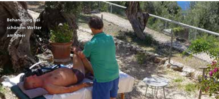
Behandlung bei schönem Wetter am Meer